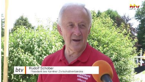
btv Rudolf Schober Präsident des Kärntner Zivilschutzverbandes