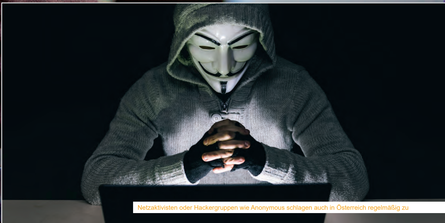
Netzaktivisten oder Hackergruppen wie Anonymous schlagen auch in Österreich regelmäßig zu

Ein zukünftiger Trend: Das Internet der Dinge (Internet of Things) bietet durch die gigantische Steigerung von vernetzten Computern im Internet (geschätzte 50 Milliarden im Jahr 2020) ein erhebliches Potenzial für Cyberkriminalität. Diese Computer agieren vom Besitzer selbständig (der Kühlschrank bestellt, das Auto sendet permanent an den Hersteller, die Versicherung oder der Herzschrittmacher an den Arzt oder Hersteller) und werden meist nur mit sehr schwachen Sicherheitsfunktionen ausgestattet. Welches Potenzial sich daraus lukrieren lässt, war vor kurzem anhand des Angriffs auf ein entsprechendes Netzwerk zu sehen, der massive Folgen u.a. für Netflix, Amazon und PayPal hatte.