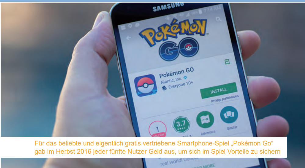
Für das beliebte und eigentlich gratis vertriebene Smartphone-Spiel „Pokémon Go“ gab im Herbst 2016 jeder fünfte Nutzer Geld aus, um sich im Spiel Vorteile zu sichern

oder die Verbreitung von Schadsoftware ab. Nichts desto trotz werden ein Drittel bis die Hälfte aller Spam-Mails geöffnet. Zudem kommen Internettrends, die oftmals offensichtlich dumm und gefährlich sind und dennoch bereitwillig mitgemacht werden. So folgte 2014 auf die eher harmlose „Ice Bucket Challenge“, bei der man sich für einen guten Zweck Eiswasser über den Kopf leert, immer extremere Videos, bis ein 15-jähriger die „Fire Challenge“ startete. Dabei leerte er sich Alkohol über den Oberkörper, um sich danach anzuzünden. Der junge „Initiator“ überlebte schwer verletzt, ein „Imitator“ kam dabei zu Tode. Seit vielen Jahren weit verbreitet ist das sogenannte Sexting, bei dem sich gegenseitig anstößige Nachrichten und auch Nacktfotos geschickt werden, die später aber zum Leid vieler Betroffener veröffentlicht werden und zu Mobbing führen. 2015 gaben bei einer Studie rund ein Drittel aller österreichischen Jugendlichen an, mit diesem „Trend“ bereits in Berührung gekommen zu sein, jeder Sechste gab an solche Fotos von sich gemacht bzw. verschickt zu haben.