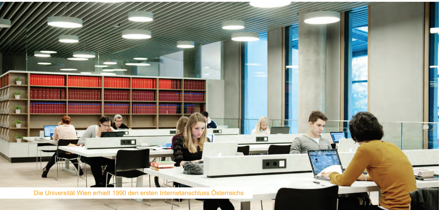
Die Universität Wien erhielt 1990 den ersten Internetanschluss Österreichs

darunter auch das Internet. Der 1969 installierte Vorläufer des Internets hieß ARPANET (Advanced Research Projects Agency Network) und vernetzte zu Beginn vier Forschungseinrichtungen mittels Telefonleitungen. Erst mit der Abschaltung des ARPANET und der Freigabe zur kommerziellen Nutzung des Internets 1990 sollte die Vernetzung ihren Siegeszug antreten können. Im selben Jahr erhielt auch Österreich den ersten Internetanschluss, um die Universität Wien mit dem Forschungszentrum CERN in der Schweiz zu verbinden.