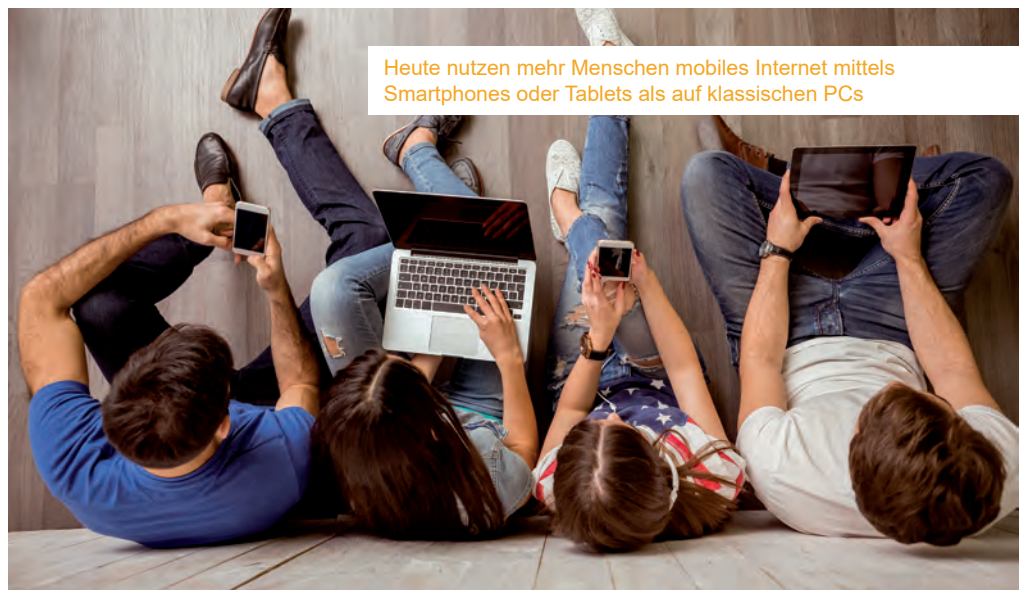
Heute nutzen mehr Menschen mobiles Internet mittels Smartphones oder Tablets als auf klassischen PCs

mit dem Internet verbunden, werden. So wie alle Innovationen und tiefgreifenden Änderungen unseres Zusammenlebens, sind auch durch das Internet immer präzisere Regeln und Verhaltensregeln notwendig. Bereits Mitte der 1880er Jahre prägten Automobile das Stadtbild, erste Gesetze zur Straßenverkehrsordnung wurden erst zu Beginn des 20. Jahrhunderts erlassen und werden bis heute laufend angepasst. Auch das Internet birgt, wie das Automobil, nicht nur Vorteile, sondern auch Gefahren und die rechtlichen Rahmenbedingungen werden mehr und mehr geregelt und Regelverstöße werden zunehmend geahndet.