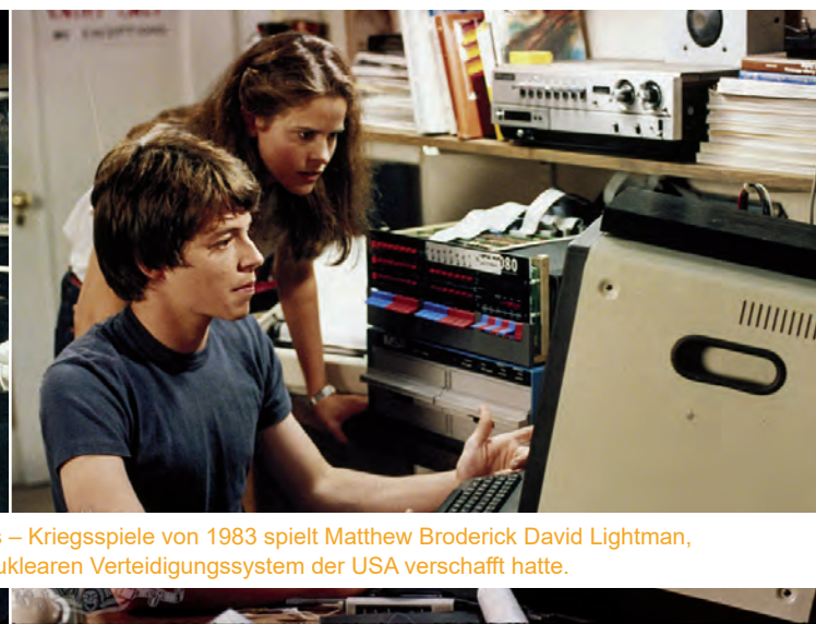
Im Kinofilm War Games – Kriegsspiele von 1983 spielt Matthew Broderick David Lightman, der sich Zugang zum nuklearen Verteidigungssystem der USA verschafft hatte.