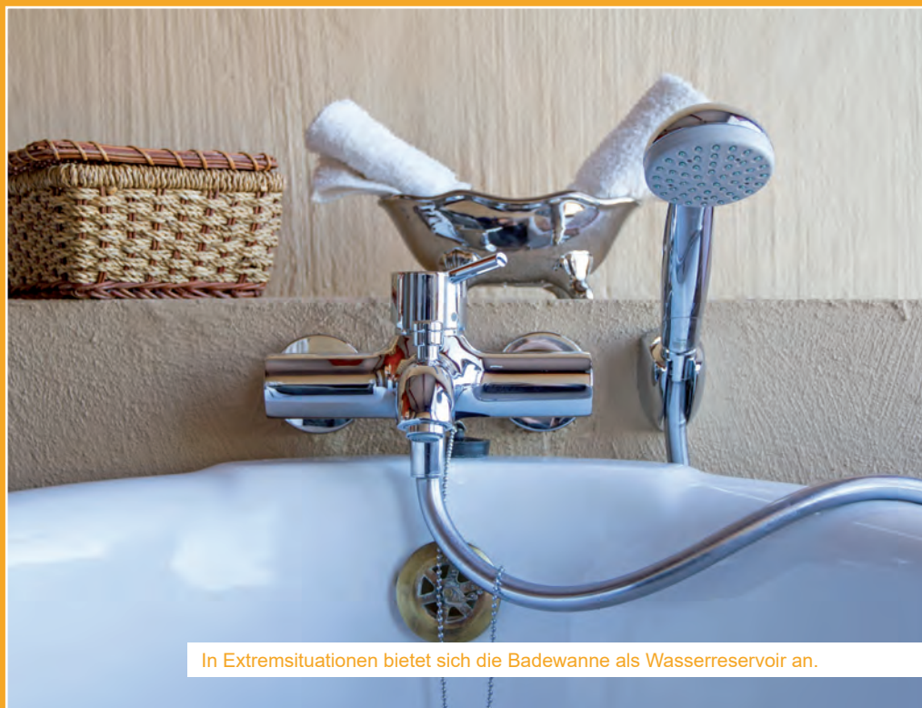
In Extremsituationen bietet sich die Badewanne als Wasserreservoir an.

Wenn man, zum Beispiel bei einem längeren Stromausfall, keine Möglichkeit vorfindet das Wasser abzukochen, dann gibt es auch die Möglichkeit das Wasser mittels Sonneneinstrahlung zu desinfizieren. Das sogenannte SODIS-Verfahren (Solar Water Disinfection) wird als effektive Maßnahme zur Trinkwasserherstellung auch von der WHO empfohlen und vor allem in Entwicklungsländern angewendet. Man benötigt dazu nur eine Glasflasche oder PET-Plastikflasche, die im Idealfall 0,5 Liter und höchstens 2,5 Liter fasst und lässt diese in der prallen Sonne für rund 6 Stunden waagrecht