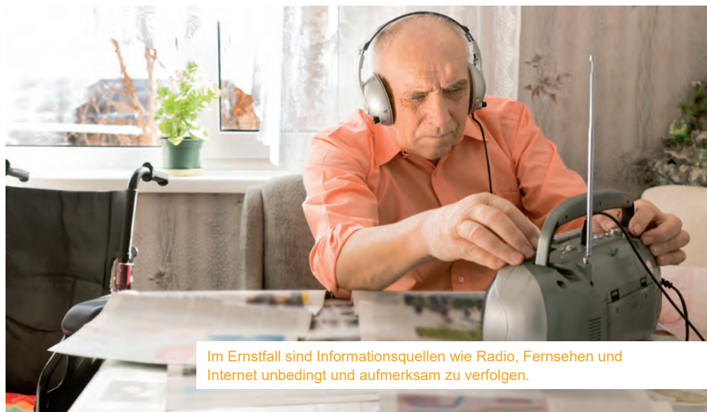
Im Ernstfall sind Informationsquellen wie Radio, Fernsehen und Internet unbedingt und aufmerksam zu verfolgen.

Zudem ist darauf zu achten, dass man für alle Jahreszeiten gerüstet ist, man weiß nicht, wann man auf seine Vorräte zurückgreifen muss. Auch wenn es