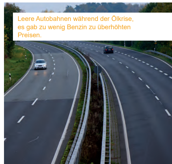
Leere Autobahnen während der Ölkrise, es gab zu wenig Benzin zu überhöhten Preisen.

All diese Beispiele zeigen uns, dass Hamsterkäufe ein massenpsychologisches Phänomen sind, die negative Entwicklungen zusätzlich beschleunigen können. Nur rechtzeitige und wohl überlegte Vorbereitung garantiert im Fall der Fälle Unabhängigkeit.