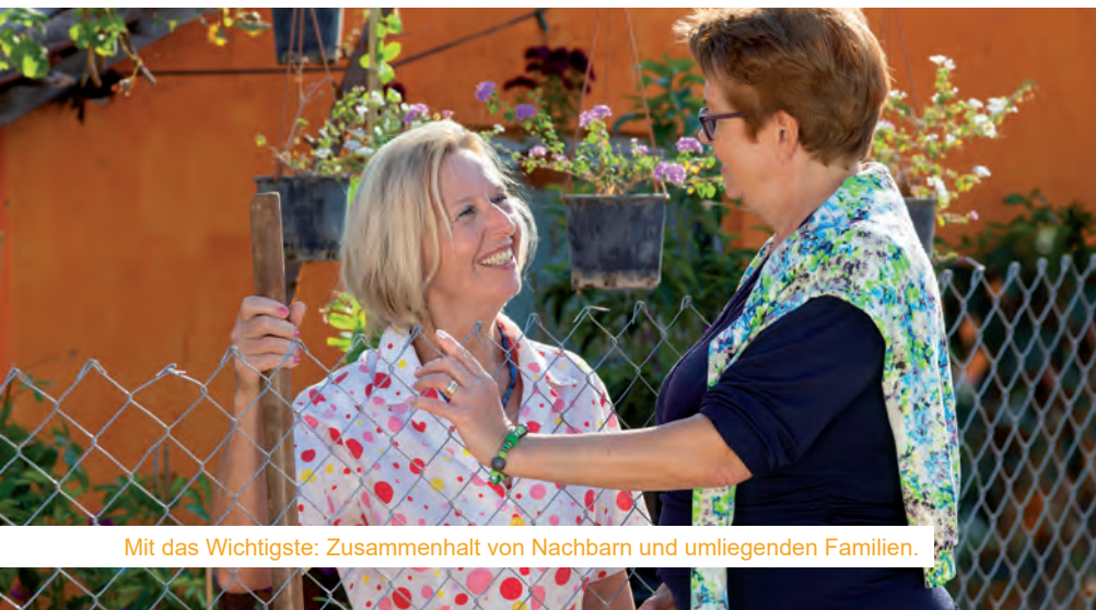
Mit das Wichtigste: Zusammenhalt von Nachbarn und umliegenden Familien.

zum Kochen eignet sich, wie in den voran gegangenen Kapiteln beschrieben, eine rechtzeitig gefüllte Badewanne als Wasserreservoir. Das ist zum Beispiel im Fall eines Reaktorunfalles, wie in Tschernobyl wichtig, da nach einem möglichen radioaktiven Niederschlag auch das Trinkwasser aus der Wasserleitung für einige Tage die Grenzwerte überschreiten kann. Empfohlen wird auch eine Schachtel Micropur Tabletten für jeden Haushalt - für weniger als 20 Euro kann man damit 100 Liter Wasser entkeimen bzw. haltbar machen.