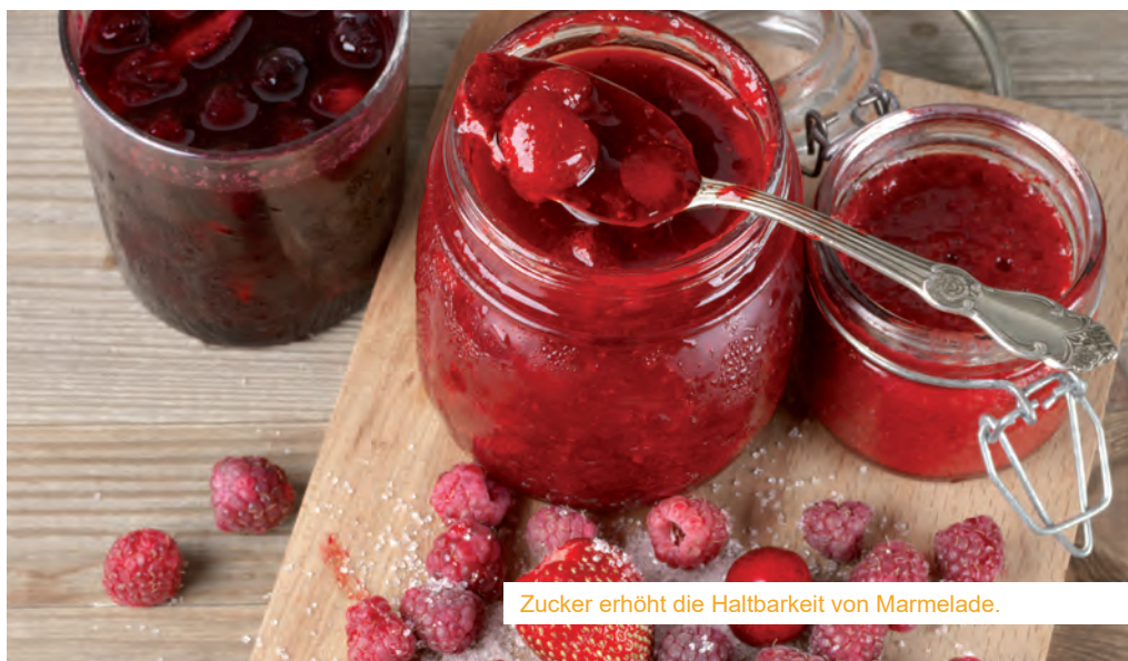
Zucker erhöht die Haltbarkeit von Marmelade.

terium befinden. Generell sollten Konserven bei 12-18 Grad gelagert werden. Linsen, Bohnen, Erbsen und Kichererbsen gehören zu lang haltbaren Hülsenfrüchten (über 1 Jahr). Aber Achtung: Ungeschälte Hülsenfrüchte müssen noch 7-8 Stunden eingeweicht werden, damit sie gar werden. Zahlreiche Früchte gibt es auch in Konserven zu kaufen. Nüsse sind wichtige Energielieferanten. Je nach Sorte und Lagerung sind diese monatelang haltbar. Sollten sie abweichend schmecken, die Oberfläche von Schimmel oder schwarzen Stellen befallen sein, sollte man diese entsorgen, da gefährliche Schimmelpilzgifte vorhanden sein können. Öle in Dosen sind länger haltbar als in Glas- oder Plastikbehälter. Wenn das Öl nicht ranzig schmeckt, dann kann man es bedenkenlos verwenden. Lein-, Traubenkern-, Kürbiskern- und Walnussöl enthalten viele ungesättigte Fettsäuren und sind ca. sechs Monate haltbar, Sonnenblumen und Rapsöl hingegen ein Jahr. Rindfleisch ist bei einer Lagerung von 2° C drei bis vier Tage im Kühlschrank