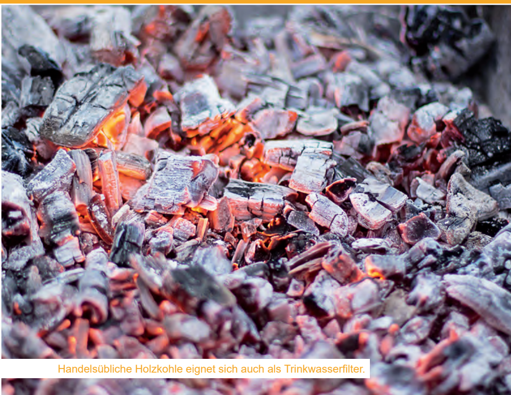
Handelsübliche Holzkohle eignet sich auch als Trinkwasserfilter.

Wie wichtig sauberes Wasser zum Trinken und zur Hygiene ist, zeigen die drohenden zumeist bakteriellen Infektionskrankheiten wie Cholera, Ruhr oder Typhus. Sie haben Durchfall, Bauchschmerzen, Fieber oder Krämpfe zur Folge und können unbehandelt zum Tod führen.