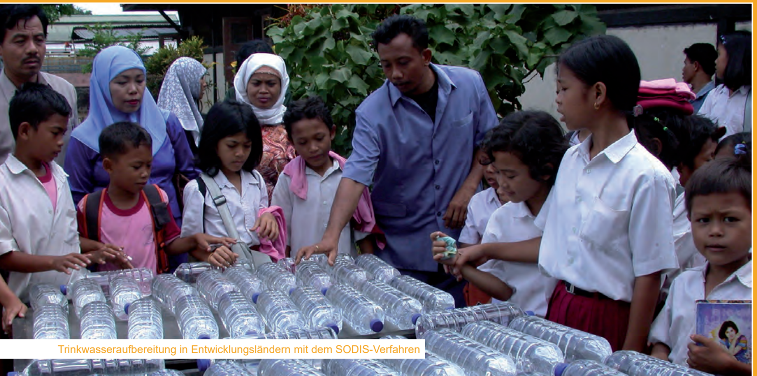
Trinkwasseraufbereitung in Entwicklungsländern mit dem SODIS-Verfahren