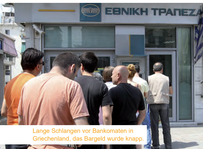
Lange Schlangen vor Bankomaten in Griechenland, das Bargeld wurde knapp.

Wir kennen das Szenario aus Katastrophenfilmen wie Mad Max oder Postman. Es kommt kein Strom mehr aus der Steckdose, Wasserhähne fließen nicht mehr und zu allem Überfluss sind die Regale in Supermärkten leer und können nicht mehr nachgefüllt werden.