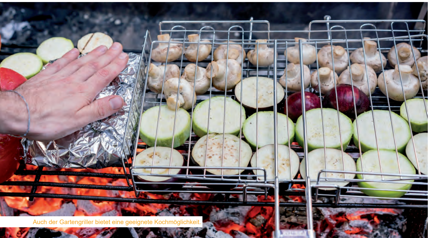
Auch der Gartengriller bietet eine geeignete Kochmöglichkeit.