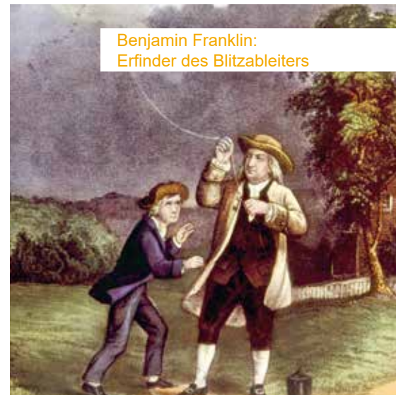
Benjamin Franklin: Erfinder des Blitzableiters

und Mobiltelefone an, sondern können heute auch Photovoltaikstrom von Einfamilienhäusern speichern und somit unser zu Hause praktisch „energieautonom“ machen, auch wenn ein Anschluss an das Stromnetz weiterhin notwendig sein wird. Der stetig steigende Strombedarf hat aber bis heute auch Schattenseiten. Zerstörte Landstriche in Folge des Kohleabbaus und vor allem die ständige Gefahr die von Atomkraftwerken ausgeht. Als gegen Ende des 19. Jahrhunderts die wissenschaftlichen Grundlagen der Radioaktivität von Antoine Henri Becquerels sowie Marie und Pierre Curie entdeckt wurden, wusste noch niemand, wie gefährlich die neue Technologie eigentlich ist. Als im August 1945 die Atombomben auf Hiroshima und Nagasaki abgeworfen wurden, wussten es alle. Dennoch ging 9 Jahre später das erste Atomkraftwerk in der Nähe Moskaus ans Netz. Und