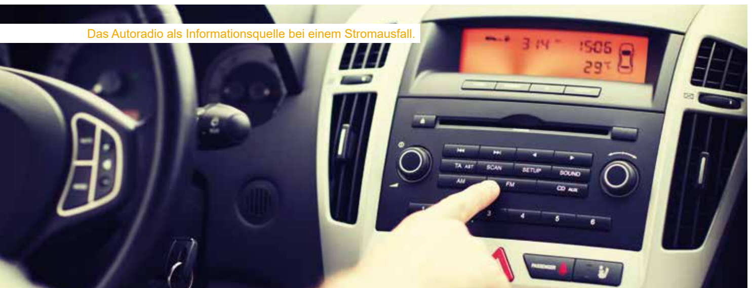
Das Autoradio als Informationsquelle bei einem Stromausfall.

Einen umfangreichen Überblick über alle empfohlenen Maßnahmen bietet der Österreichische Zivilschutzverband in einer eigens dafür zusammengestellten Broschüre. Ebenfalls können Produkte im Webshop des Zivilschutzverbandes