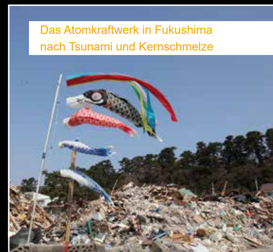
Das Atomkraftwerk in Fukushima nach Tsunami und Kernschmelze

nicht. Folgendes war geschehen: Nach dem Erdbeben wurde das Kraftwerk heruntergefahren. Der dafür notwendige externe Strom zur Kühlung war aber bereits ausgefallen. Durch den Tsunami wurde die letzte Möglichkeit, nämlich der Abfluss ins Meer, zerstört. Durch die darauffolgende Kernschmelze in drei Reaktorblöcken wurde doppelt so viel radioaktives Material als in Tschernobyl 1986 freigesetzt, 8 Prozent der japanischen Landfläche wurden verstrahlt, 160.000 Menschen mussten dauerhaft evakuiert werden. Der Gesamtschaden wurde auf 260 Mrd. US-Dollar geschätzt. Stromausfälle waren auch in den Folgemonaten Gefahrenquellen für die Kühlung des havarierten Atomkraftwerks.