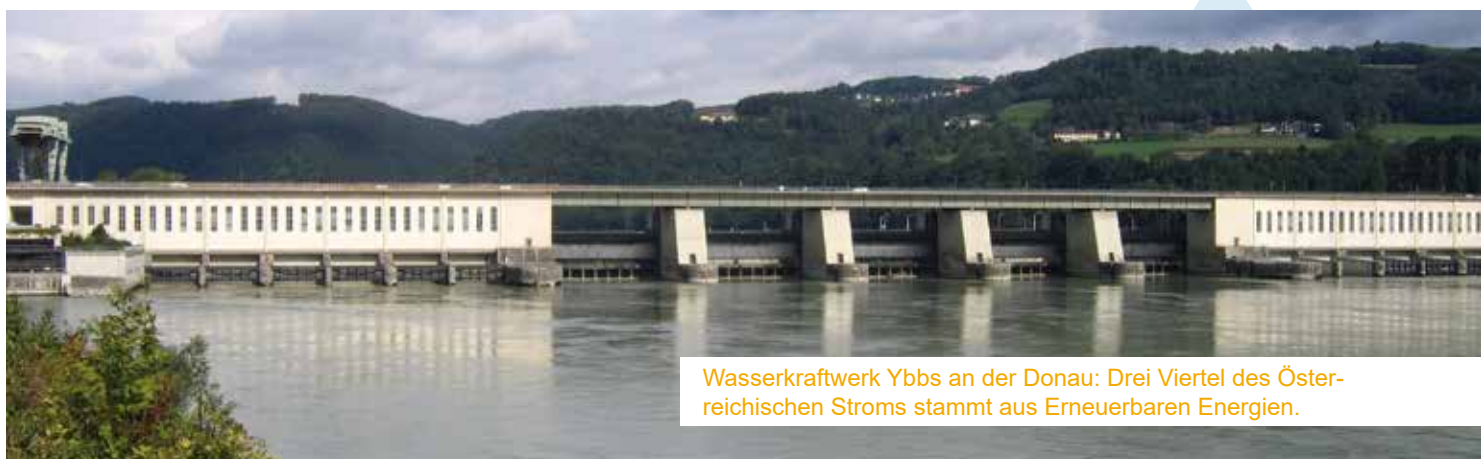
Wasserkraftwerk Ybbs an der Donau: Drei Viertel des Österreichischen Stroms stammt aus Erneuerbaren Energien.

Die Entzauberung und Entmystifizierung der Elektrizität und in weiterer Folge die Nutzbarmachung erfolgten erst zu Beginn des 18. Jahrhunderts, nachdem im 17. Jahrhundert sogenannte Elektrisierungsmaschinen in erster Linie der Belustigung