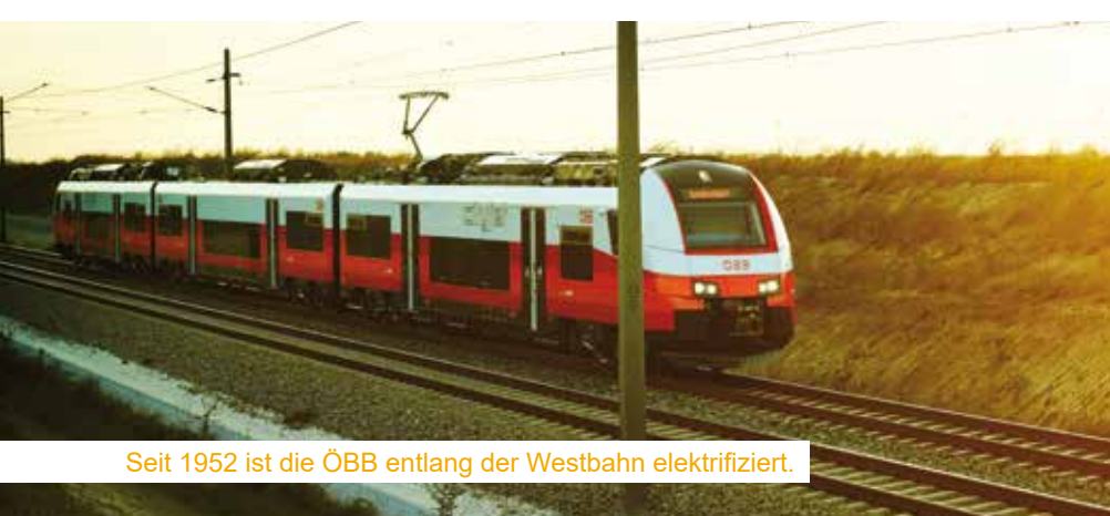
Seit 1952 ist die ÖBB entlang der Westbahn elektrifiziert.

November 1978 entschieden sich 50,47 Prozent der Österreicherinnen und Österreicher gegen die Inbetriebnahme des inzwischen fast fertiggestellten ersten Reaktors in Zwentendorf und gegen den Bau weiterer Anlagen. Heute erzeugt Österreich keinen Strom aus Atomkraft und gilt mit einem Schwerpunkt auf Erneuerbare Energien wie Wasser- und Windkraft als europaweites Vorbild. Österreich hat durch seine geografische Lage das Glück, die Stromversorgung vor allem auf die erneuerbare Ressource Wasserkraft abstützen zu können. In den letzten Jahren sind auch Wind- und Sonnenkraftwerke hinzugekommen.