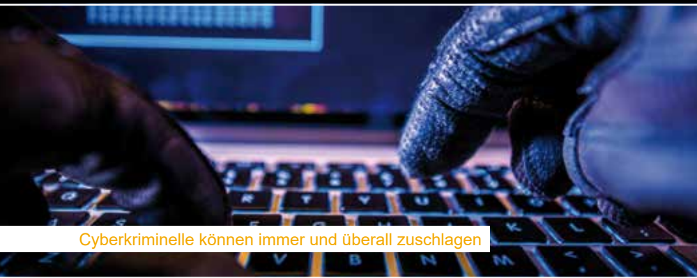
Cyberkriminelle können immer und überall zuschlagen

Als im März 2015 gegen 10 Uhr in 80 von 81 türkischen Provinzen der Strom ausfiel und fast 80 Mio. Menschen stundenlang ohne Strom auskommen mussten, mutmaßten Medien zu Beginn einen Terror- bzw. Hackerangriff als Ursache, immerhin wurde kurz zuvor die Webseite des staatlichen Stromnetzbetreibers gehackt. Die Folgen waren jedenfalls verheerend, alle öffentlichen Verkehrsmittel und Ampeln fielen aus, lösten ein Verkehrschaos aus und führten zu einem wirtschaftlichen Gesamtschaden von rund 700 Mio. Euro. Tatsächlich verursachten aber landesinterne Schwankungen den Zusammenbruch.