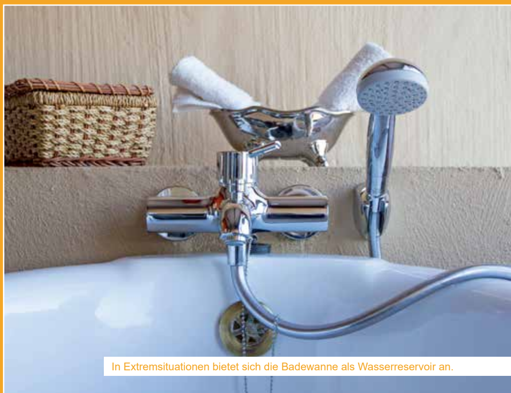
In Extremsituationen bietet sich die Badewanne als Wasserreservoir an.

Wenn man, zum Beispiel bei einem längeren Stromausfall, keine Möglichkeit vorfindet das Wasser abzukochen, dann gibt es auch die Möglichkeit das Wasser mittels Sonneneinstrahlung zu desinfizieren. Das sogenannte SODIS-Verfahren (Solar Water Disinfection) wird als effektive Maßnahme zur Trinkwasserherstellung auch von der WHO empfohlen und vor allem in Entwicklungsländern angewendet. Man benötigt dazu nur eine Glasflasche oder PET-Plastikflasche, die im Idealfall 0,5 Liter und höchstens 2,5 Liter fasst und lässt diese in der prallen Sonne für rund 6 Stunden waagrecht