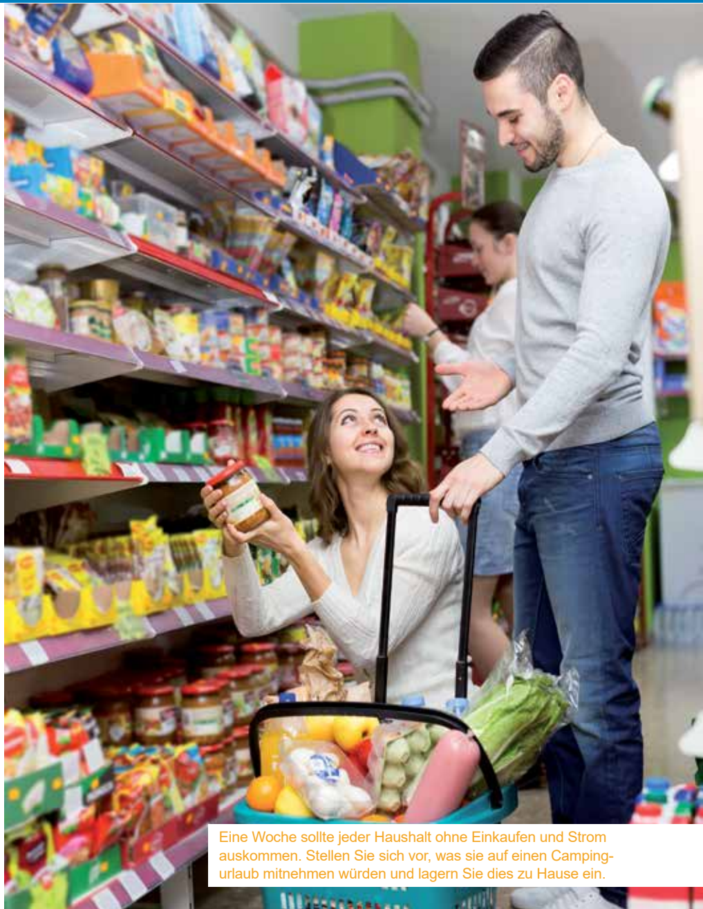
Eine Woche sollte jeder Haushalt ohne Einkaufen und Strom auskommen. Stellen Sie sich vor, was sie auf einen Camping- urlaub mitnehmen würden und lagern Sie dies zu Hause ein.

Da man im Fall der Fälle, zum Beispiel bei einem Hochwasser, auch mit einer Evakuierung rechnen sollte, ist es ratsam alle wichtigen Dokumente immer griff- bereit zu haben. Im Idealfall hat man die persönliche Dokumentenmappe auch weitgehend wasserdicht verpackt. Sollte man nicht mehr rechtzeitig seine Doku- mente sichern können, bleiben nämlich Geburts- oder Besitzurkunden trotz Hochwasser erhalten. Gerade für Haushalte, die von Hochwasser ge- fährdet sind, aber auch bei einfachen Wasserrohrbrüchen, sind Wasser- schutzsäcke zu empfehlen. Sie können aber nicht nur vor Wasser-einbruch schützen, sondern auch rund 20 Liter Wasser aufnehmen und sind deshalb