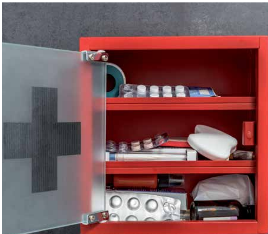
Medikamente immer in Originalverpackung mit Beipackzettel lagern. (Symbolfoto)

Bluthochdruck leidet zum Beispiel jeder vierte Österreicher. Nur rund die Hälfte der Bevölkerung kennt ihren eigenen Blutdruckwert. Und auch die eigene Blutgruppe ist vielen Österreichern unbekannt.