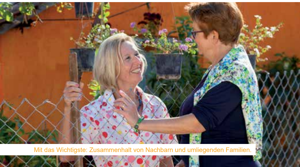
Mit das Wichtigste: Zusammenhalt von Nachbarn und umliegenden Familien.

zum Kochen eignet sich, wie in den voran gegangenen Kapiteln beschrieben, eine rechtzeitig gefüllte Badewanne als Wasserreservoir. Das ist zum Beispiel im Fall eines Reaktorunfalles wie in Tschernobyl wichtig, da nach einem möglichen radioaktiven Niederschlag auch das Trinkwasser aus der Wasserleitung für einige Tage die Grenzwerte überschreiten kann. Empfohlen wird auch eine Schachtel Micropur Tabletten für jeden Haushalt - für weniger als 20 Euro kann man damit 100 Liter Wasser entkeimen bzw. haltbar machen.