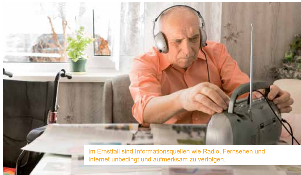
Im Ernstfall sind Informationsquellen wie Radio, Fernsehen und Internet unbedingt und aufmerksam zu verfolgen.

Zudem ist darauf zu achten, dass man für alle Jahreszeiten gerüstet ist, man weiß nie, wann man auf seine Vorräte zurückgreifen muss. Auch wenn es