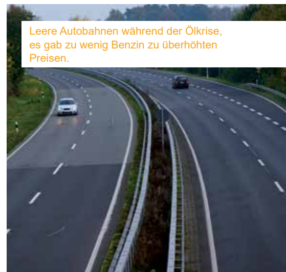
Leere Autobahnen während der Ölkrise, es gab zu wenig Benzin zu überhöhten Preisen.

All diese Beispiele zeigen uns, dass Hamsterkäufe ein massenpsychologisches Phänomen sind, die negative Entwicklungen zusätzlich beschleunigen können. Nur rechtzeitige und wohl überlegte Vorbereitung garantiert im Fall des Falles Unabhängigkeit.