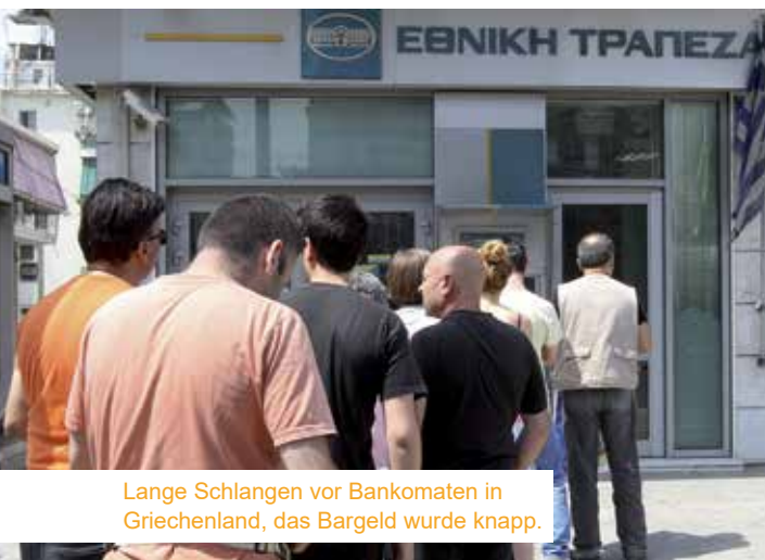
Lange Schlangen vor Bankomaten in Griechenland, das Bargeld wurde knapp.

Wir kennen das Szenario aus Katastrophenfilmen wie Mad Max oder Postman. Es kommt kein Strom mehr aus der Steckdose, Wasserhähne fließen nicht mehr und zu allem Überfluss sind die Regale in Supermärkten leer und können nicht mehr nachgefüllt werden.